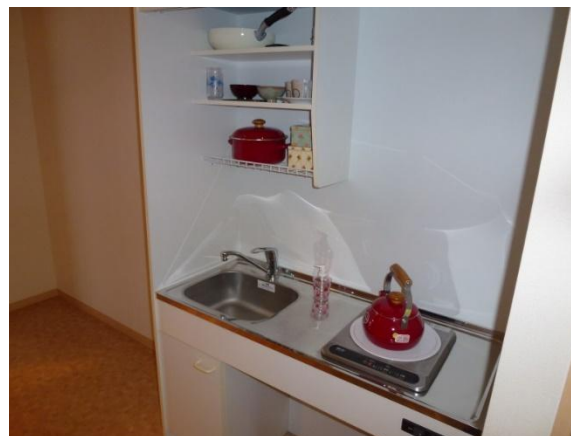
お部屋のキッチン 簡単な料理は可能です