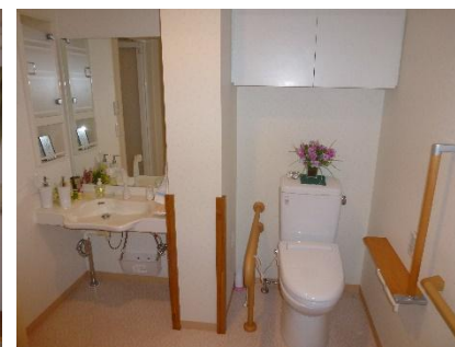
車いすでも使用可能なトイレ