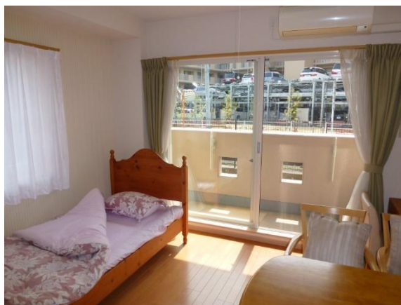
お部屋の様子（介護ベッドをレンタルします）