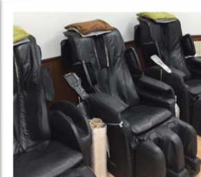
マッサージチェア（疲れた体をほぐします）